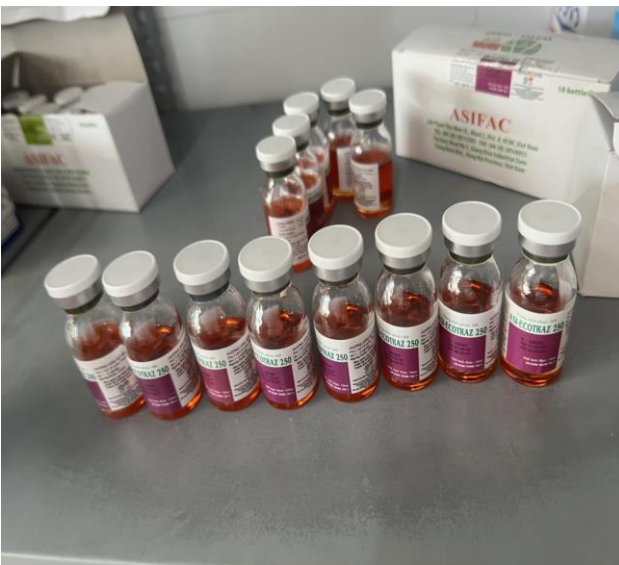
Hình ảnh: Thuốc thú y ASI-ECOTRAZ 250

- Tuy nhiên, qua kiểm tra, đối chiếu với Danh mục thuốc thú y được phép lưu hành tại Việt Nam, Chi cục Chăn nuôi và Thú y đã phát hiện một số vi phạm như sau: