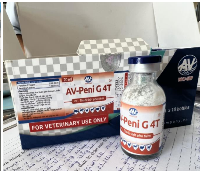
Hình ảnh: Thuốc thú y AV-Peni G4T

+ Thuốc thú y hiệu ASI-ECOTRAZ 250, quy cách: 10ml, số lượng 15 chai, sản xuất tại Công ty Cổ phần TM và SX Thuốc Thú y Thịnh Á; địa chỉ: 220 Phạm Thế Hiển, P2, Q8, TP. HCM kinh doanh tại Cửa hàng thuốc thú y Hồng Phát; địa chỉ: Khu phố 1, Bảo An, TP. Phan rang Tháp chàm có thể tích thực 9ml ngoài mức giới hạn cho phép so với thể tích ghi trên nhãn là 10ml mà nhà sản xuất đã đăng ký và được cơ quan có thẩm quyền phê duyệt.