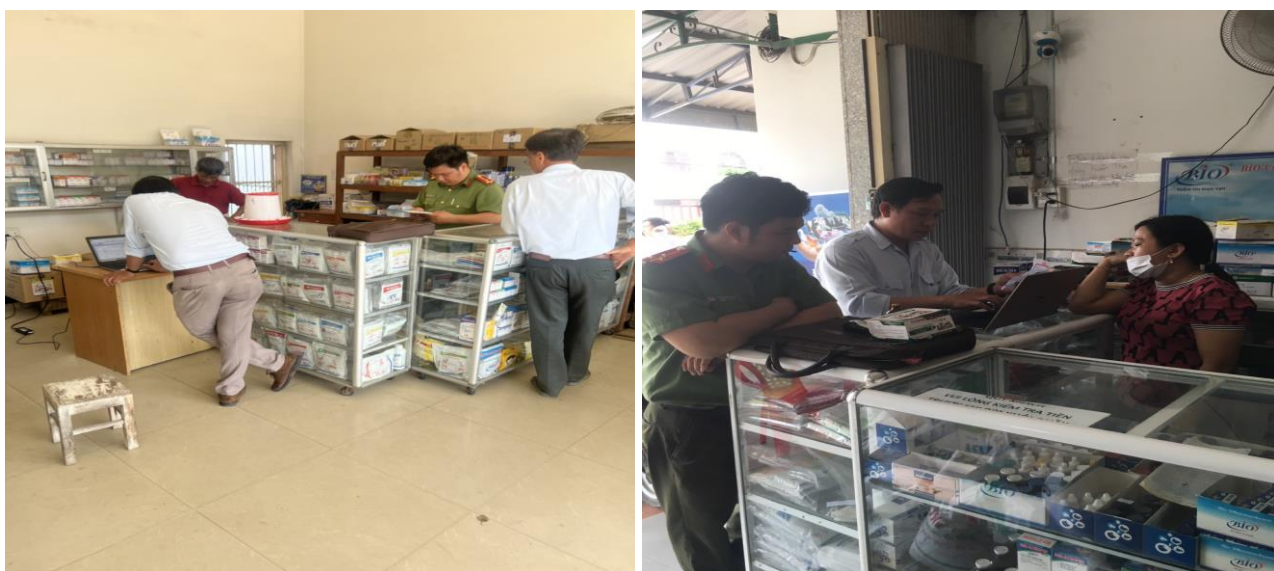
Một số hình ảnh làm việc trực tiếp tại các cơ sở

Căn cứ Quyết định số 507/QĐ-SNNPTNT ngày 10/12/2021 của Sở Nông nghiệp và Phát triển nông thôn về việc giao nhiệm vụ, kế hoạch công tác thanh tra, kiểm tra chuyên ngành năm 2022 cho 06 Chi cục quản lý chuyên ngành thuộc Sở Nông nghiệp và Phát triển nông thôn. Ngày 13/6/2022, Chi cục trưởng Chi cục Chăn nuôi và Thú y ban hành Quyết định số 41/QĐ-CCCNTY Về việc thanh tra việc chấp hành quy định pháp luật về kinh doanh thuốc thú y, thức ăn chăn nuôi của các cơ sở kinh doanh thuốc thú y, thức ăn chăn nuôi trên địa bàn tỉnh